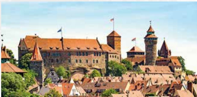
Kaiserburg Nürnberg