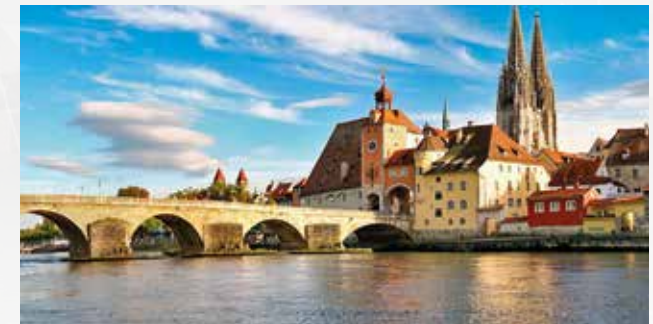
Regensburg Uferpanorama

Details zu allen Preisen und zur Höhe der Dotierungen finden Sie unter www.dgkfo.de – Wissenschaftliche Preise.