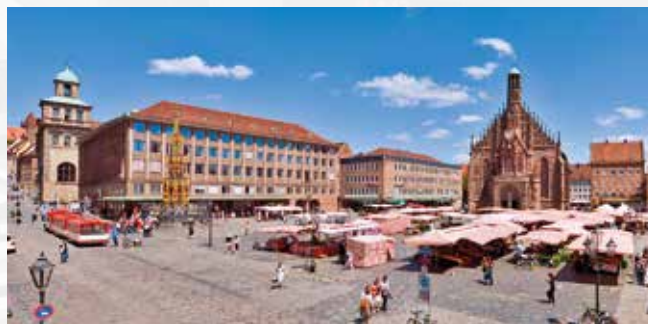
Hauptmarkt Nürnberg