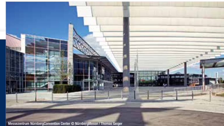
Messezentrum Nürnberg Convention Center

Nürnberg Convention Center West Messe Nürnberg